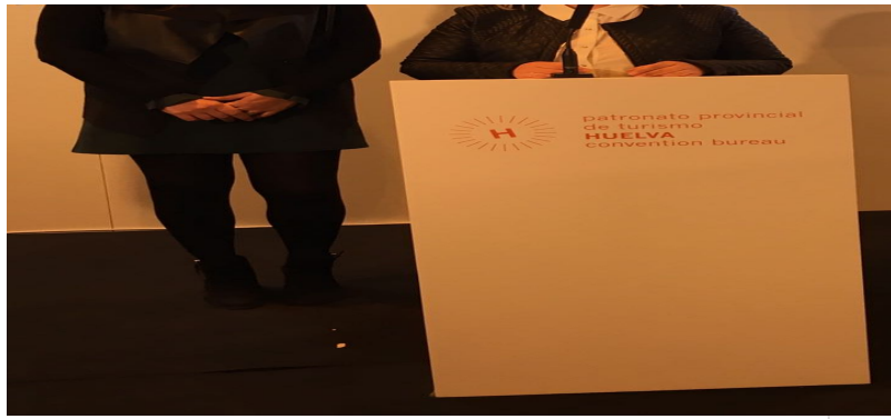
( http://www.almonasterlareal.es/export/sites/almonaster/es/.galleries/imagenes-noticias/noticias-2016/Enero/IMG-20170118-WA0025.jpg )