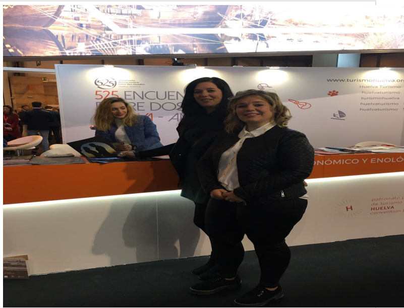
( http://www.almonasterlareal.es/export/sites/almonaster/es/.galleries/imagenes-noticias/noticias-2016/Enero/IMG-20170118-WA0004.jpg )